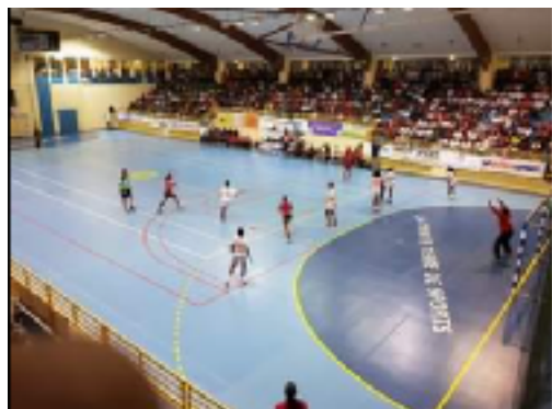
PALAIS DES SPORTS DE TRINITE