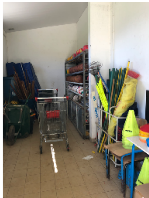
RANGEMENT SP COLL / ATHLE