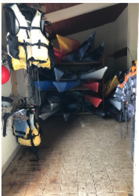
RANGEMENT PADDLE / KAYAK